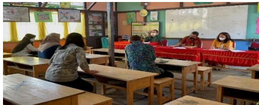
Gambar 3. FGD dengan moda daring bersama pemangku kepentingan Kabupaten Kayong Utara (KKU)