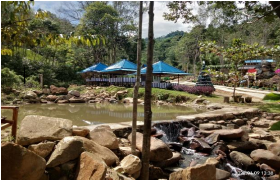
Gambar 4. Contoh Penataan Di Desa Sebente

Sebagai salah satu rujukan dalam rangka penataan kawasan hutan untuk dijadikan kawasan pariwisata, Gambar 4 perlu dicermati dengan baik.