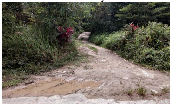
Gambar 2. Kondisi Jalan Menuju Riam Sebuluh

Akses jalan menuju lokasi Riam Sebuluh sudah cukup bagus. Namun, jalan yang menghubungkan riam dengan jalan raya masih becek hingga di titik lokasi. Ruas jalan yang masih becek ini dapat menyebabkan pengunjung enggan mengunjungi riam yang dapat dinikmati panorama dan keasriannya untuk melepas lelah sambil mandi didalamnya.