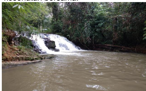
Gambar 3. Kondisi Riam Sebuluh

Kondisi air riam dapat dilihat pada Gambar 3. Kondisi ini memerlukan perhatian dan tanggung jawab bersama baik masyarakat maupun pemerintah daerah agar kelestarian alam serta kebersihan sungai sebuluh dapat dijaga dan dimanfaatkan dengan baik demi kesehatan bersama.